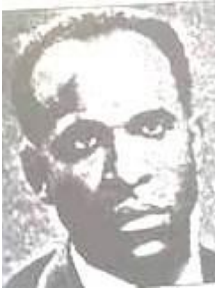
صورة لفرانتز فانون 1