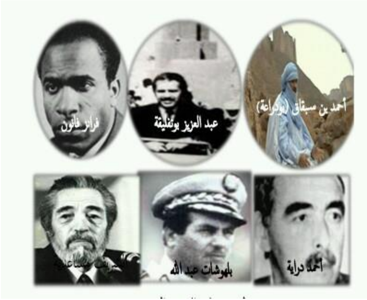
صورة لبعض قادة الجبهة الجنوبية التي دعا إليها فرانتز فانون 1