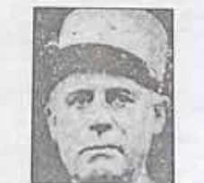
سالان و دوول

العودة إلى الإدماج ب أن فرنسا حدة وهي حدة بجزائر إلى الأبد . ب دي لول في وهران ١١ جون ١١١١ ب أن الجزائر لرس فرنسا اليوم وفي الأبد . ب دي لول في وهران ١١ جون ١١١١ ب لثنا الجزائر الفرنسية . ب دي لول في مستفام ١١ جون ١١١١ العودة إلى التهديئة ب أن الحرب قد انتهت تسليا بجزائر . بفارسال جون ١١ نوفمبر ١١١١ ب لقد طويت صفحة الفداك . ب دي لول في ثورت و ديسمبر ١١١١ ب مستطيع أن أؤكد لكم أننا ستواصل التهديئة إلى النهاية . بديري في وهران ١١ فبراير ١١١١ ب أن التهديئة بل الأواب . ب دي لول ١١ جون ١١١١