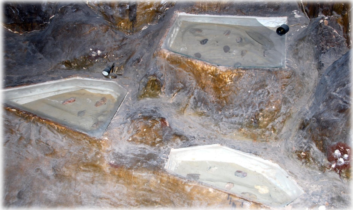
صورة رقم 28 : بعض الخزائن المدمجة مع الحائط -جناح ما قبل التاريخ-