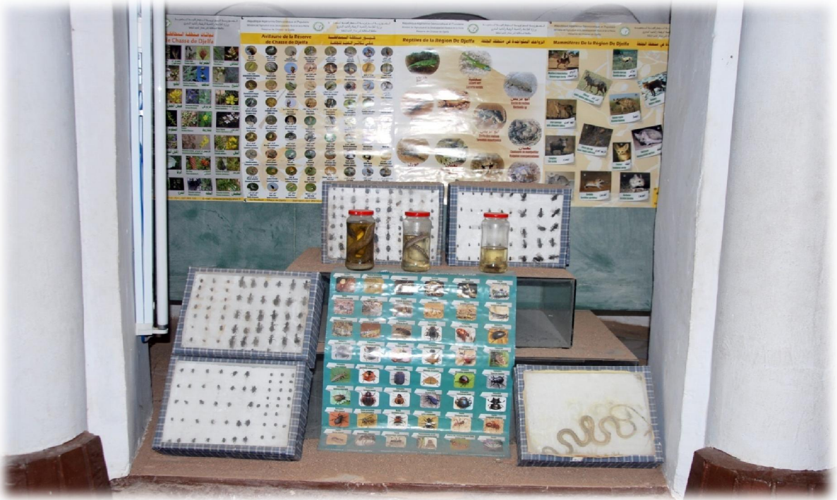
صورة رقم 22 : مجموعة من الحشرات والزواحف المعروفة في المنطقة