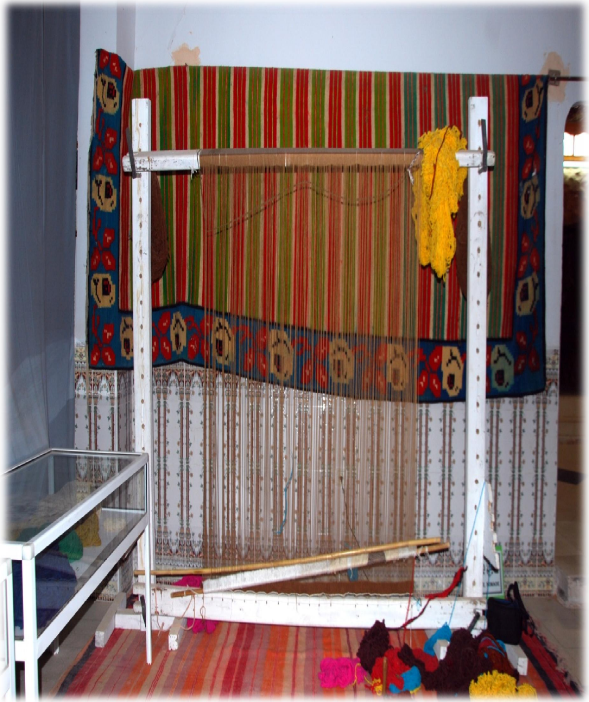
صورة رقم 29 : النول أو آلة النسيج المنزلية