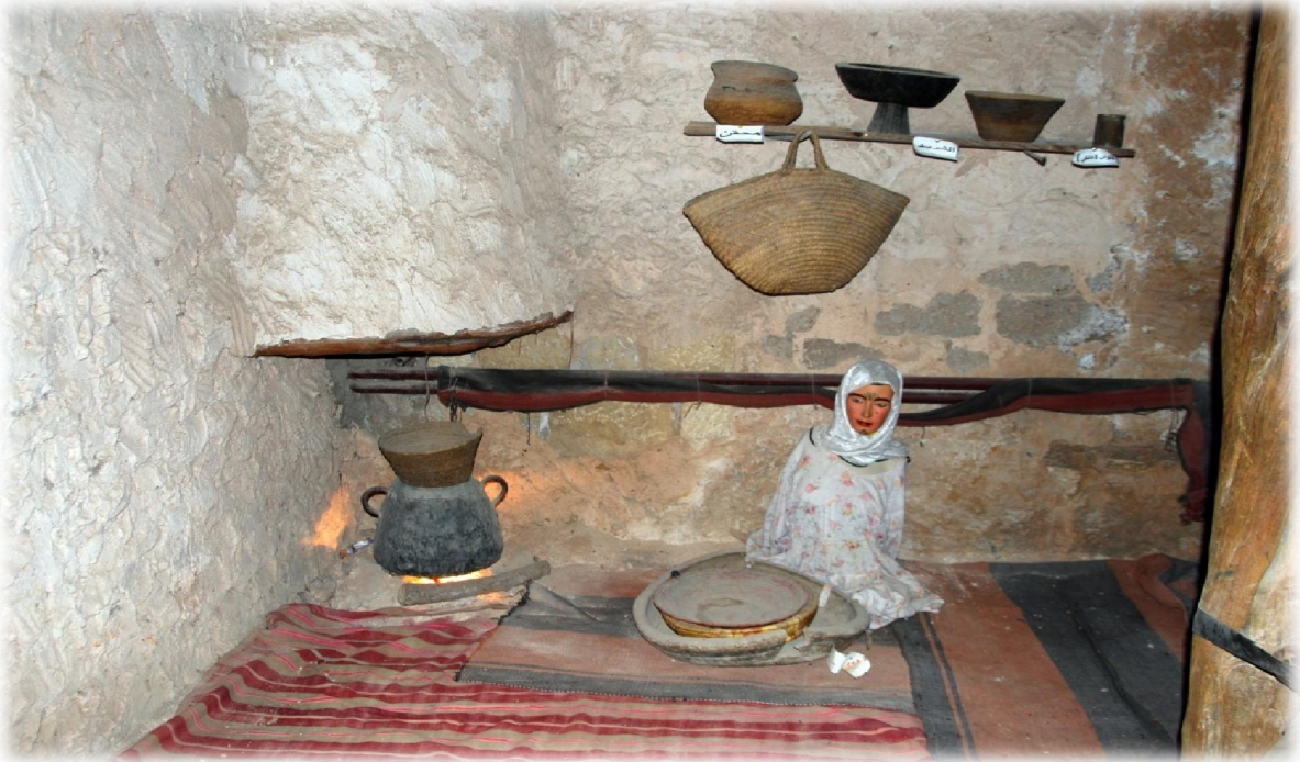
صورة رقم 14 : مجسم لبيئة المرأة (قصعة ، كانون ، غريال ... الخ)