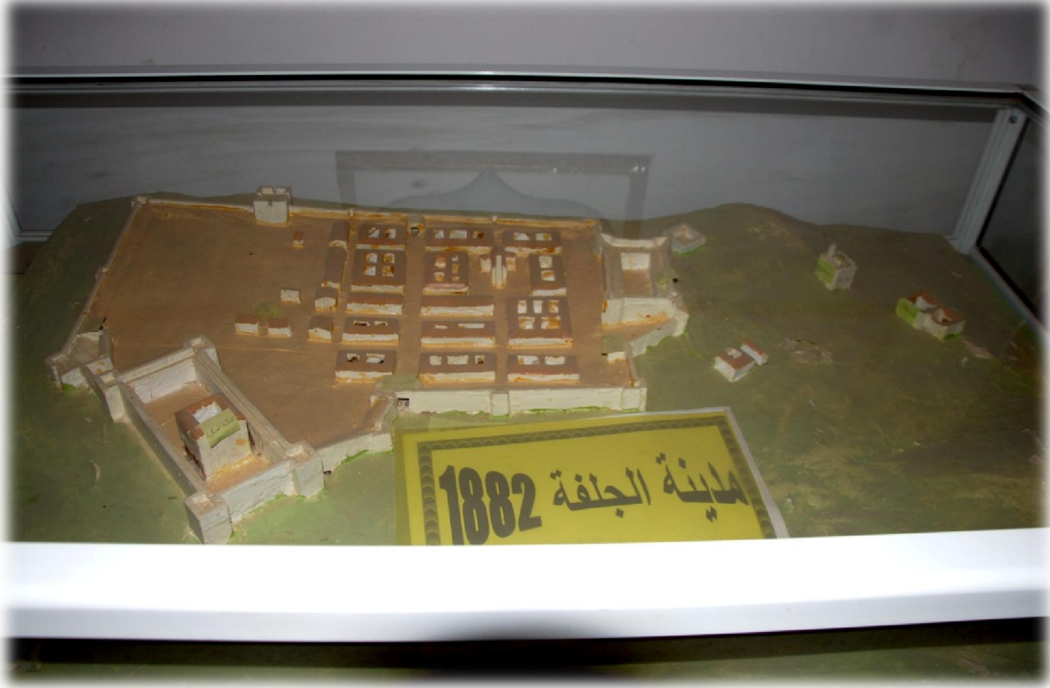
صورة رقم 15 : مجسم صغير لمدينة الجلفة عام 1882م