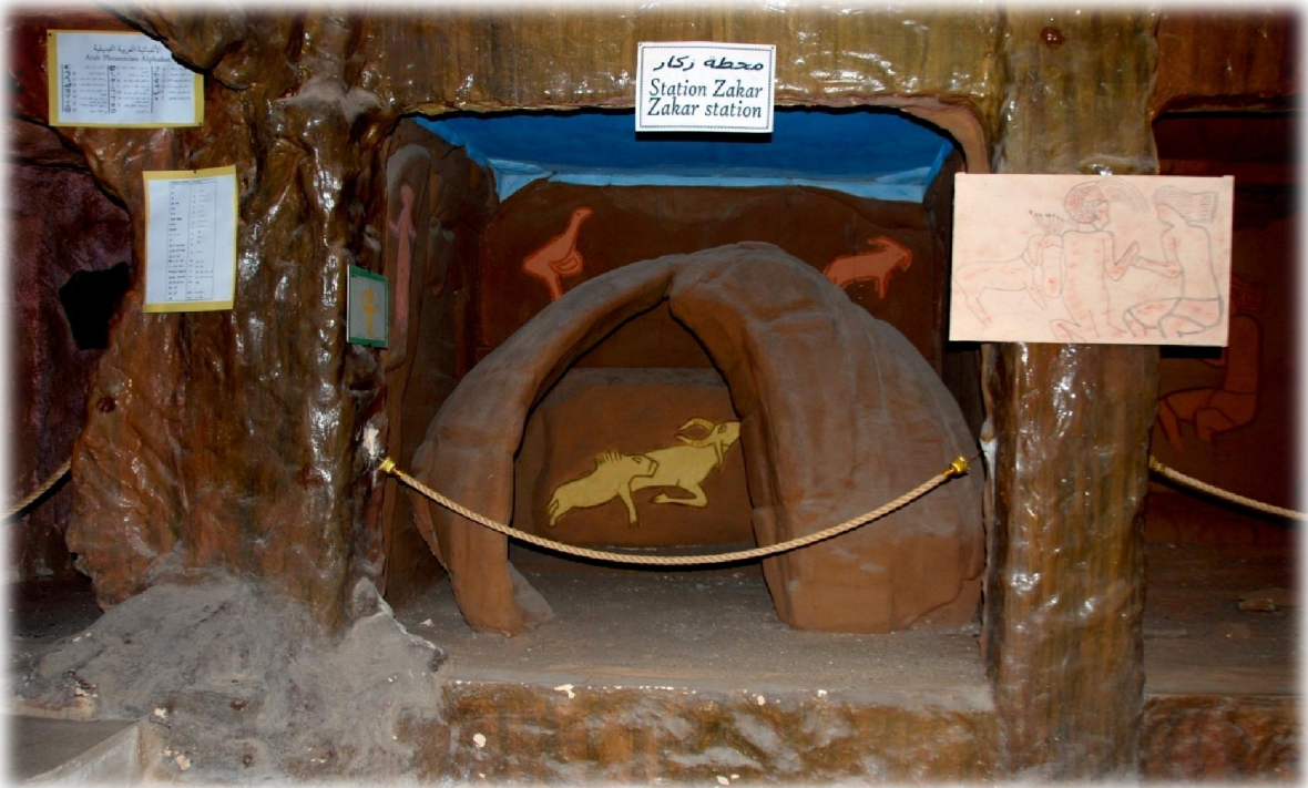
صورة رقم 20: نموذج من منطقة زكار -بعض الحيوانات-