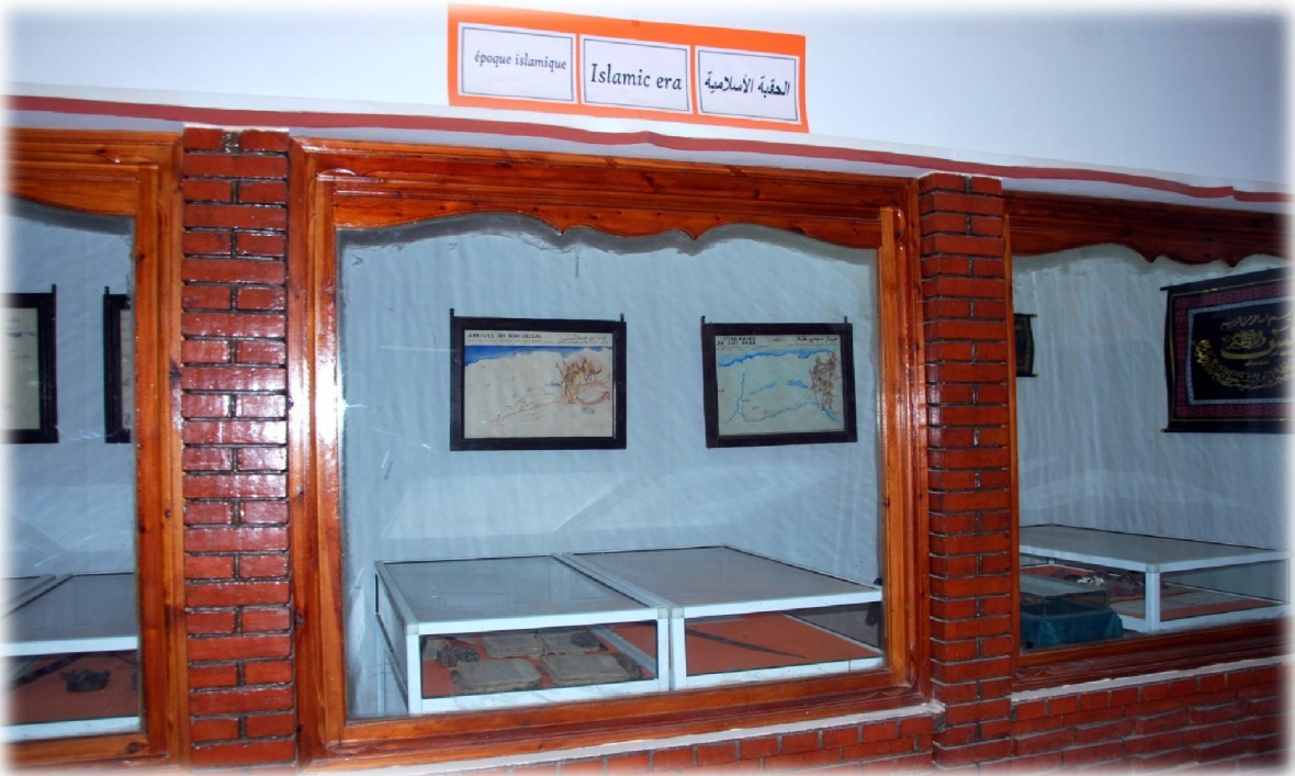
صورة رقم 16 : خزانة حائطية