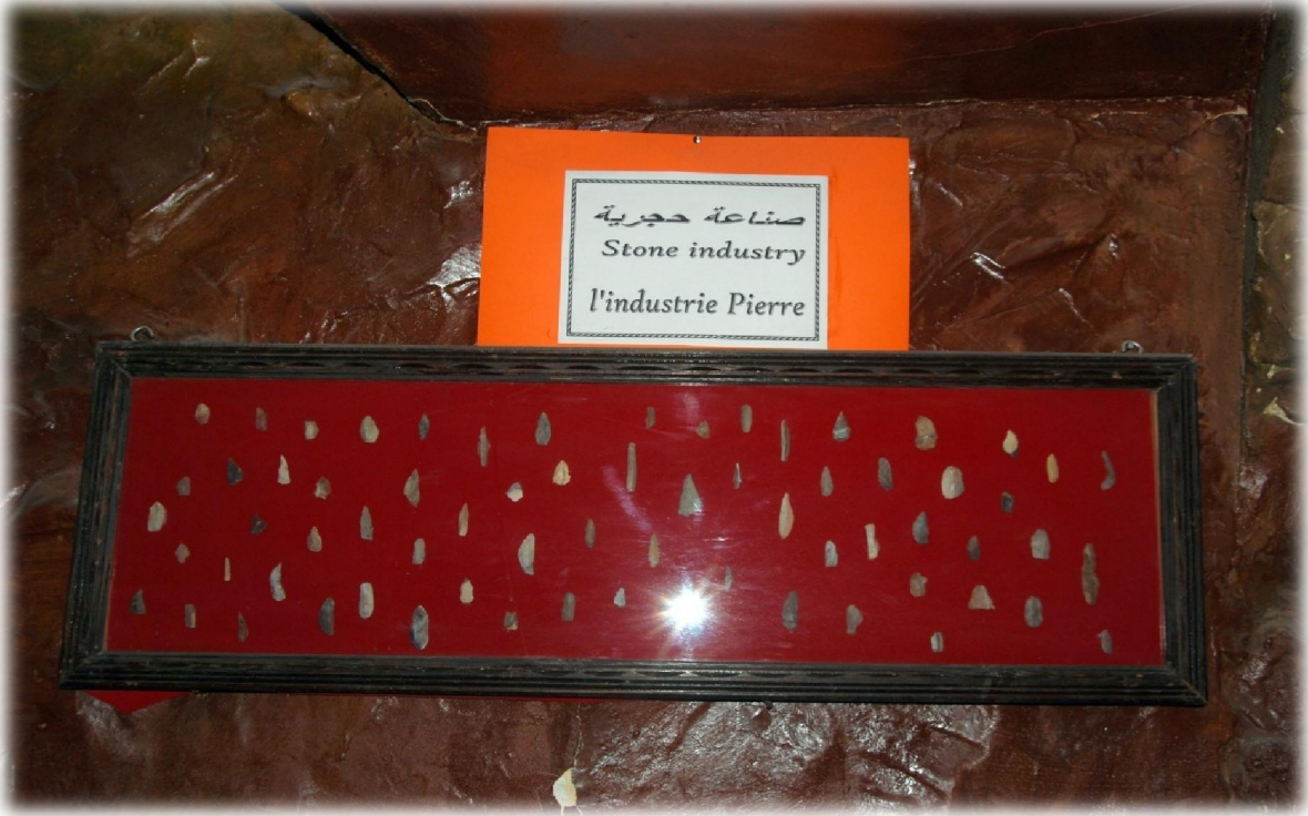
صورة رقم 23 : خزانة حائطية تحمل بعض النصال-الصناعة الحجرية -