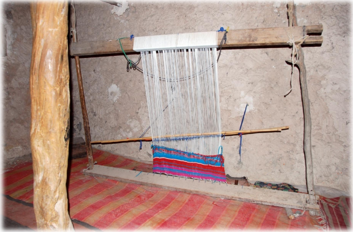
صورة رقم 13 : النول أو آلة النسيج المنزلية