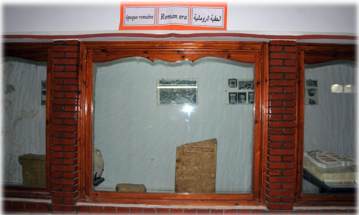
صورة رقم 11 : نصب جنائزي روماني بمنطقة مسعد