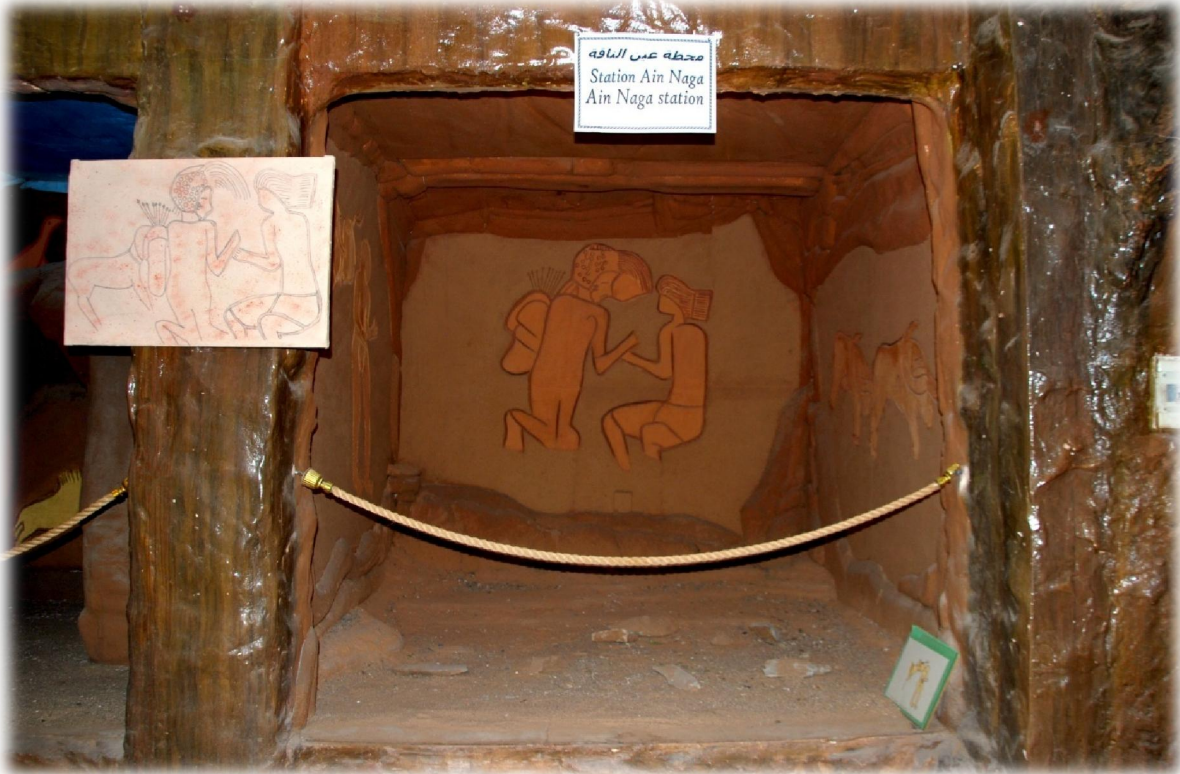
صورة رقم 19 : نموذج عن موقع العاشقان الخجولان -محطة عين ناقه -