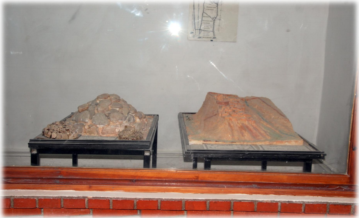
صورة رقم 10 : بعض المجسمات المصغرة