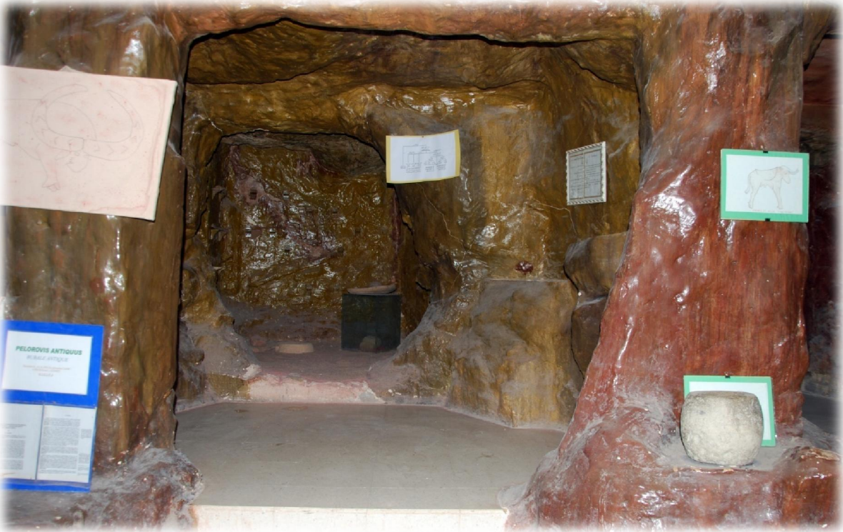
صورة رقم 24 : بعض الخزائن المدمجة مع الحائط-جناح ما قبل التاريخ-