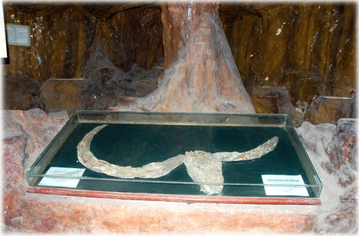
صورة رقم 27 : الثور العتيق BUBALE ANTIQUE