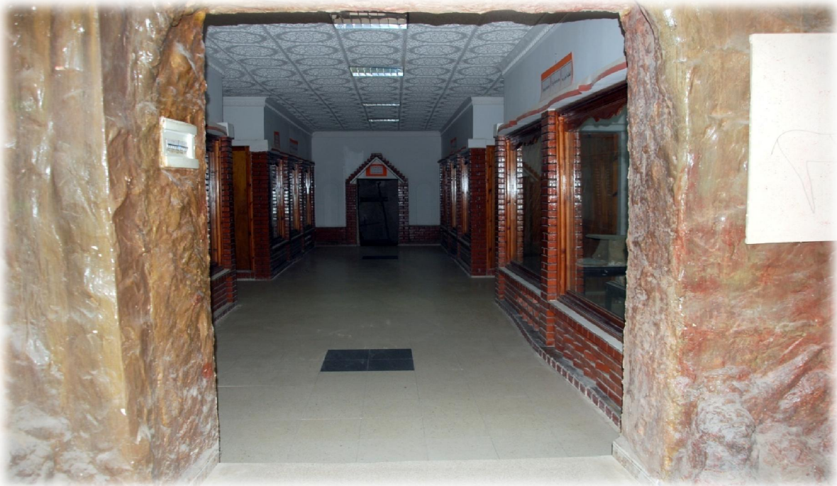
صورة رقم 9 : مدخل جناح الفترة الإسلامية