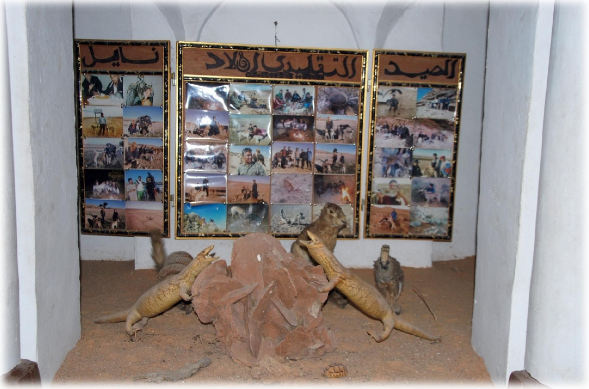
صورة رقم 21 : مجموعة من الحيوانات المحنطة