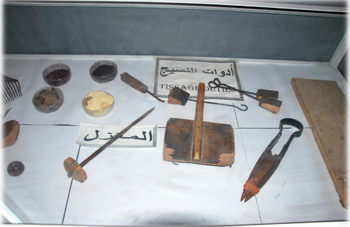
صورة رقم 30 : بعض الادوات المنزلية المهنية المعروضة في المتحف