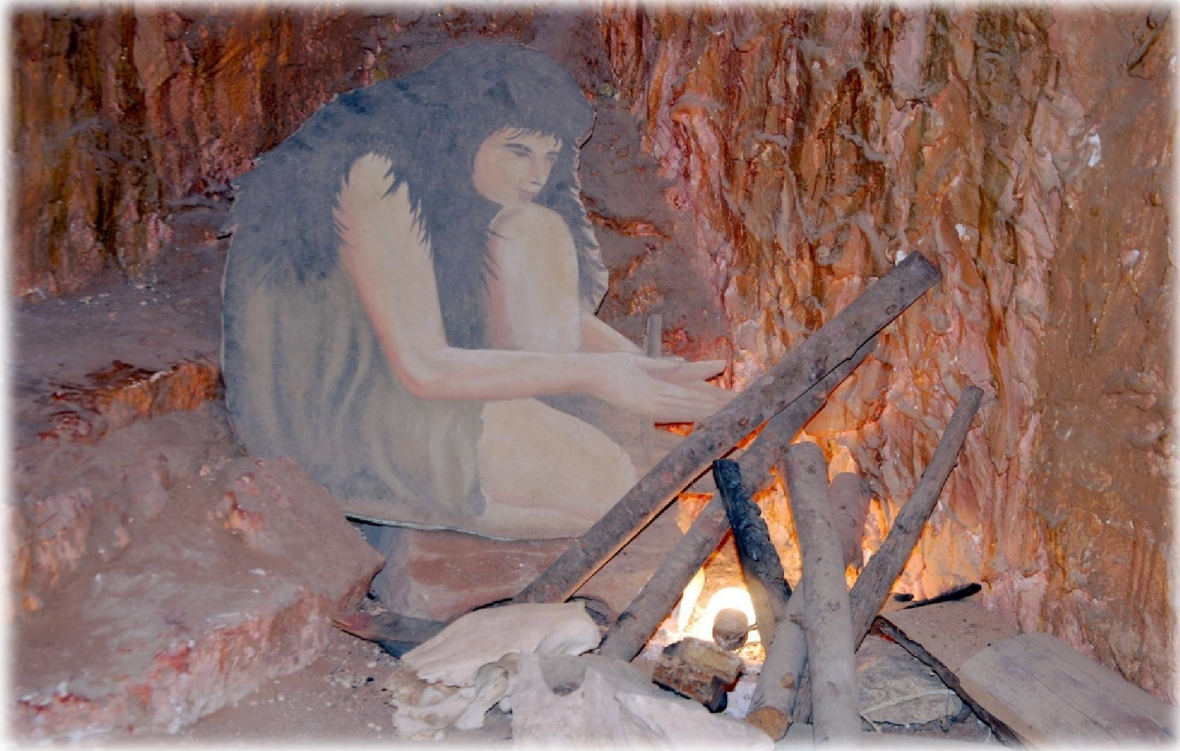
صورة رقم 26 : نموذج لكهف ما قبل التاريخ -استعمال الانسان للنار-