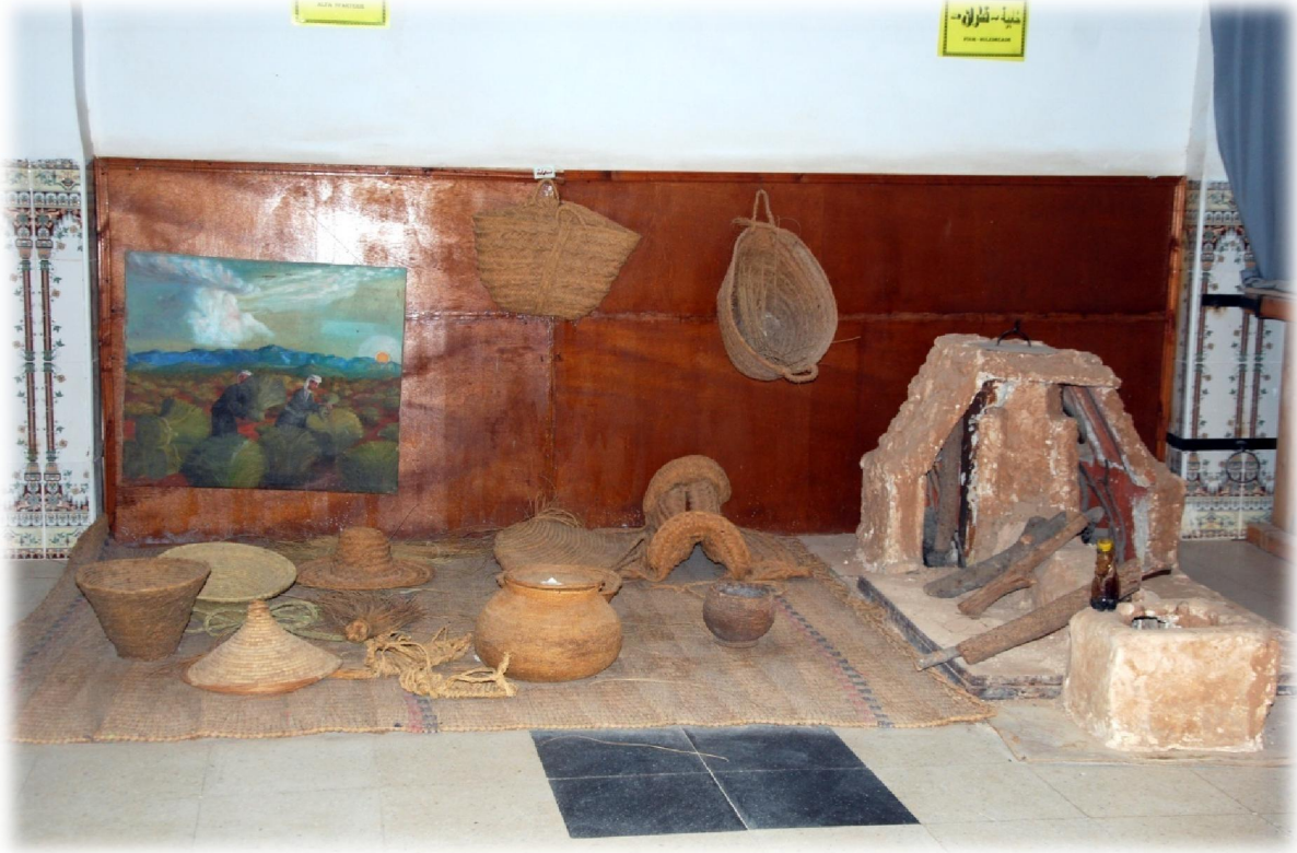
صورة رقم 7 : بعض الأدوات المهنية

البعض من صور المجموعات المعروضة بالمتحف البلدي للجلفة