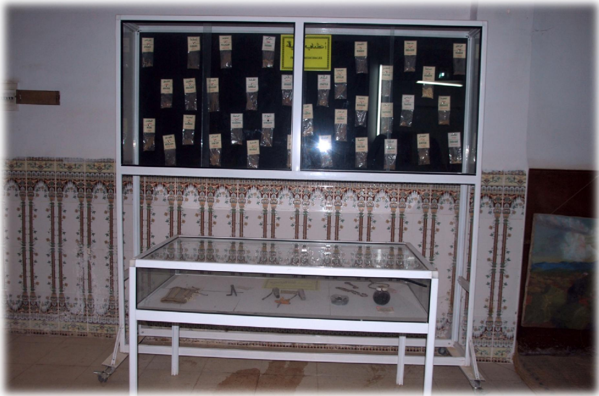
صورة رقم 8 : خزائن منقولة