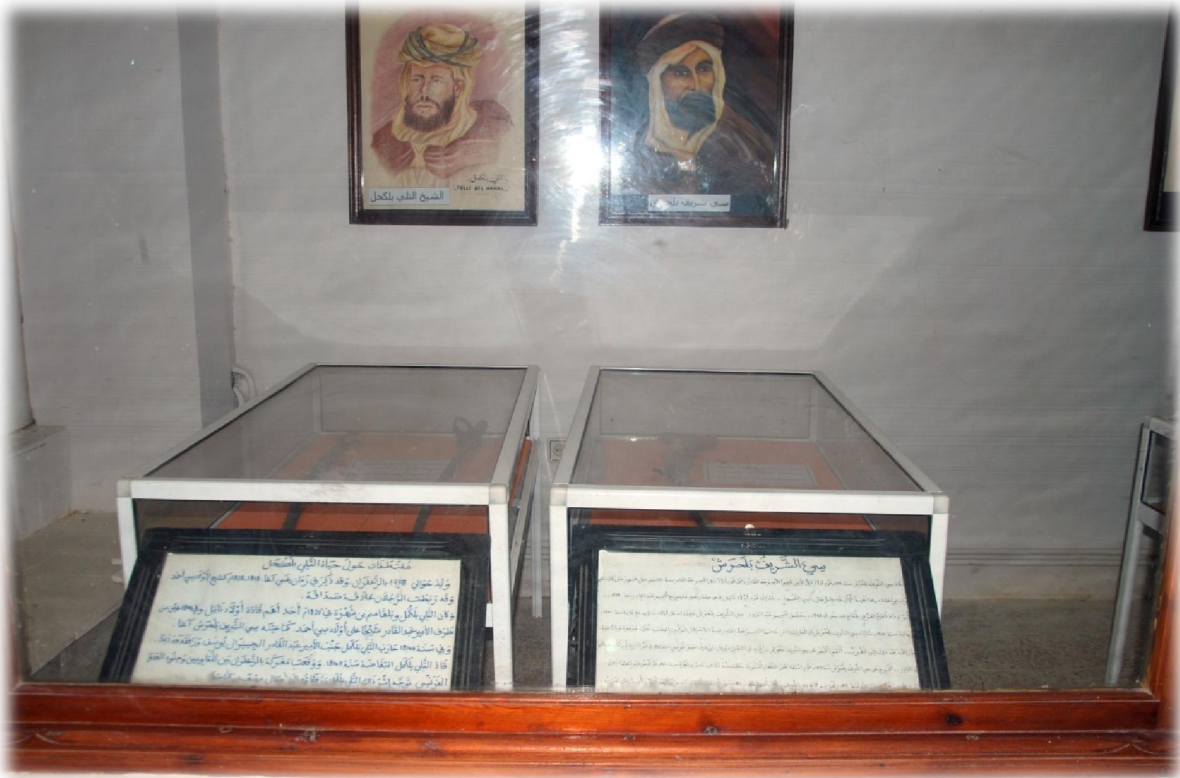
صورة رقم 17 : بعض الأسلحة المستعملة في الثورات الشعبية