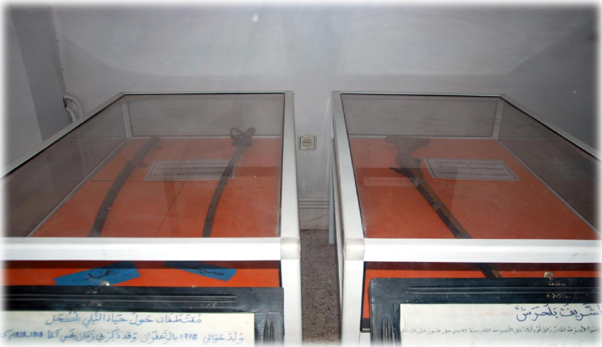
صورة رقم 18 : بعض الاسلحة المستعملة في الثورات الشعبية