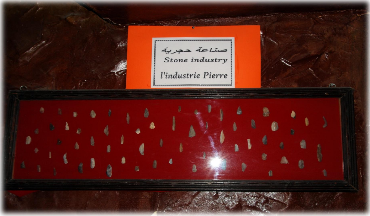
صورة رقم 25 : خزانة حائطية تحمل بعض النصال -الصناعة الحجرية-