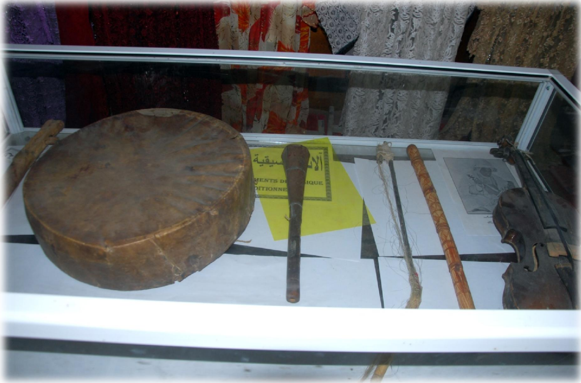
صورة رقم 32 : بعض الأدوات الفنية الخشبية