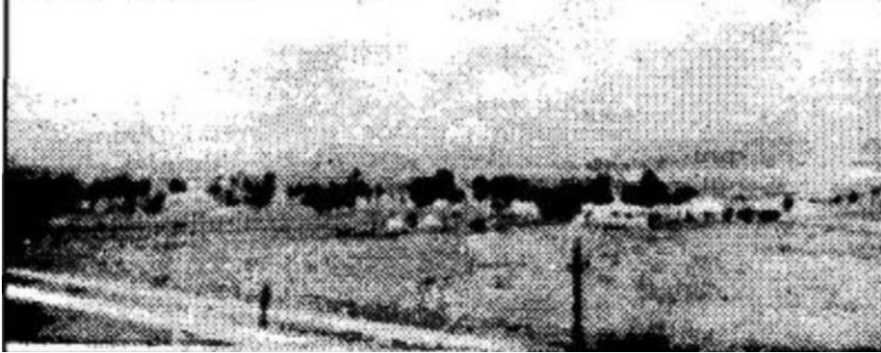
صورة منظر عام: سكة حديدية والطريق الوطني بقرية سانت مونيك - وادي الشلف-