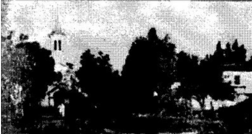
صورة لكنيسة بقرية سانت مونيك 2