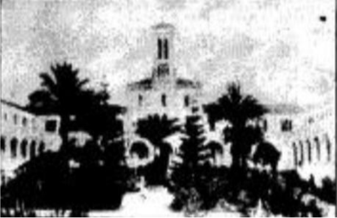
صورة مقر الآباء البيض الرئيسي 1