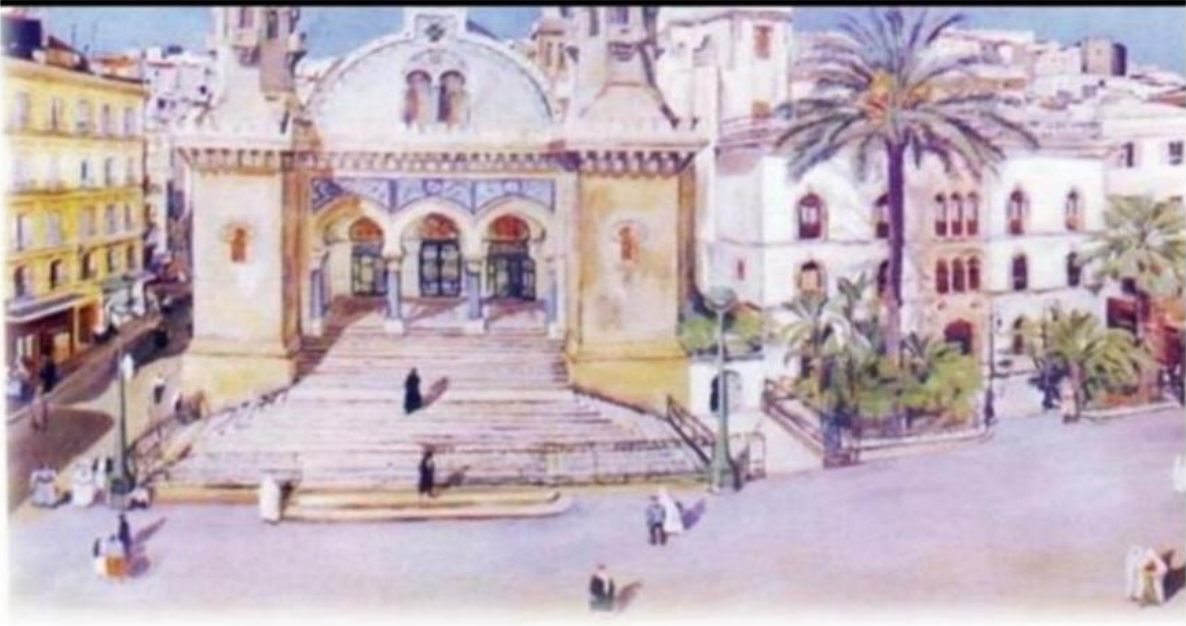
مسجد كتشاوة عند تحويله الى كنيسة كاتدرائية 1