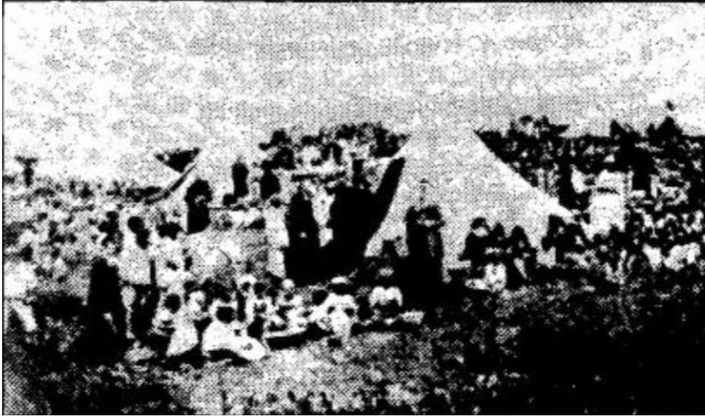
صورة للأسقف لافيغري في زيارة لمركز الأيتام بين عكنون عام 1868م 1