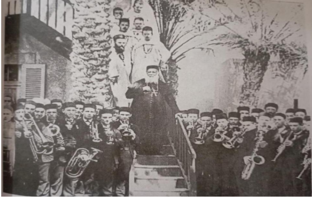
صورة للأسقف لافيغري 1