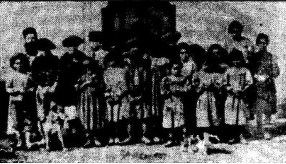
صورة لفتيات وفتيان المعمرين المسيحيين في قرية سان سيبريان 1