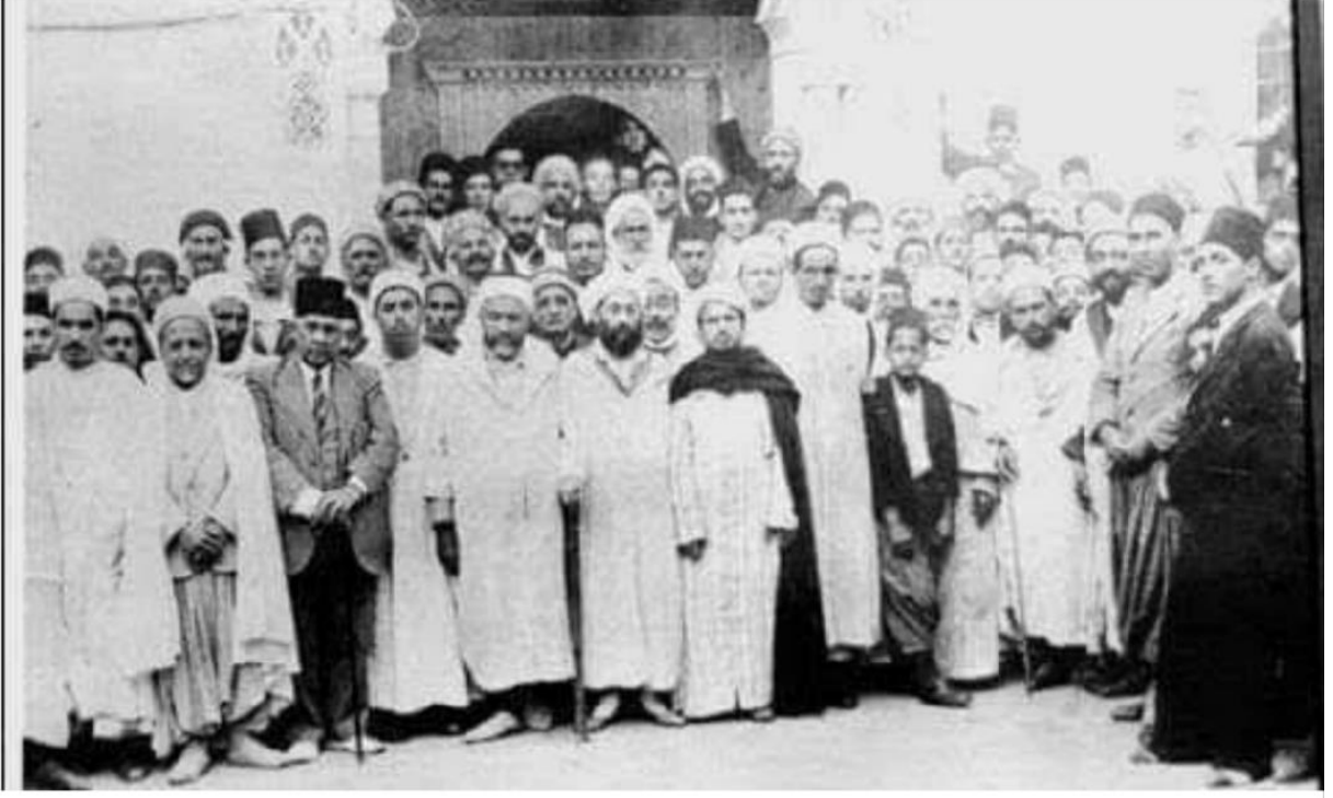
صورة جماعية للشيخ ابن باديس والبشير الإبراهيمي وأعضاء الجمعية في الإحتفال بإفتتاح دار الحديث