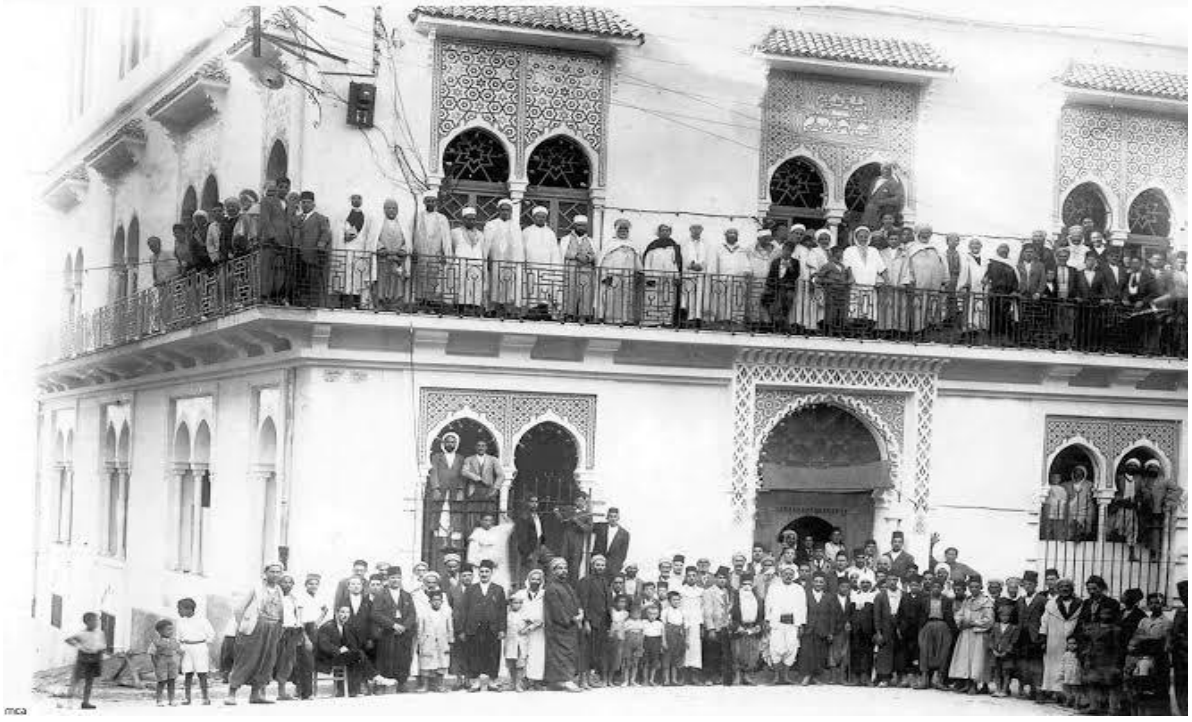
صورة جمعية من الإحتفال عند باب المدرسة

المصدر :رمضاني مراد، دار الحديث جامع ومدرسة تلمسان قلعة الإصلاح الإسلامي في الجزائر، ص01