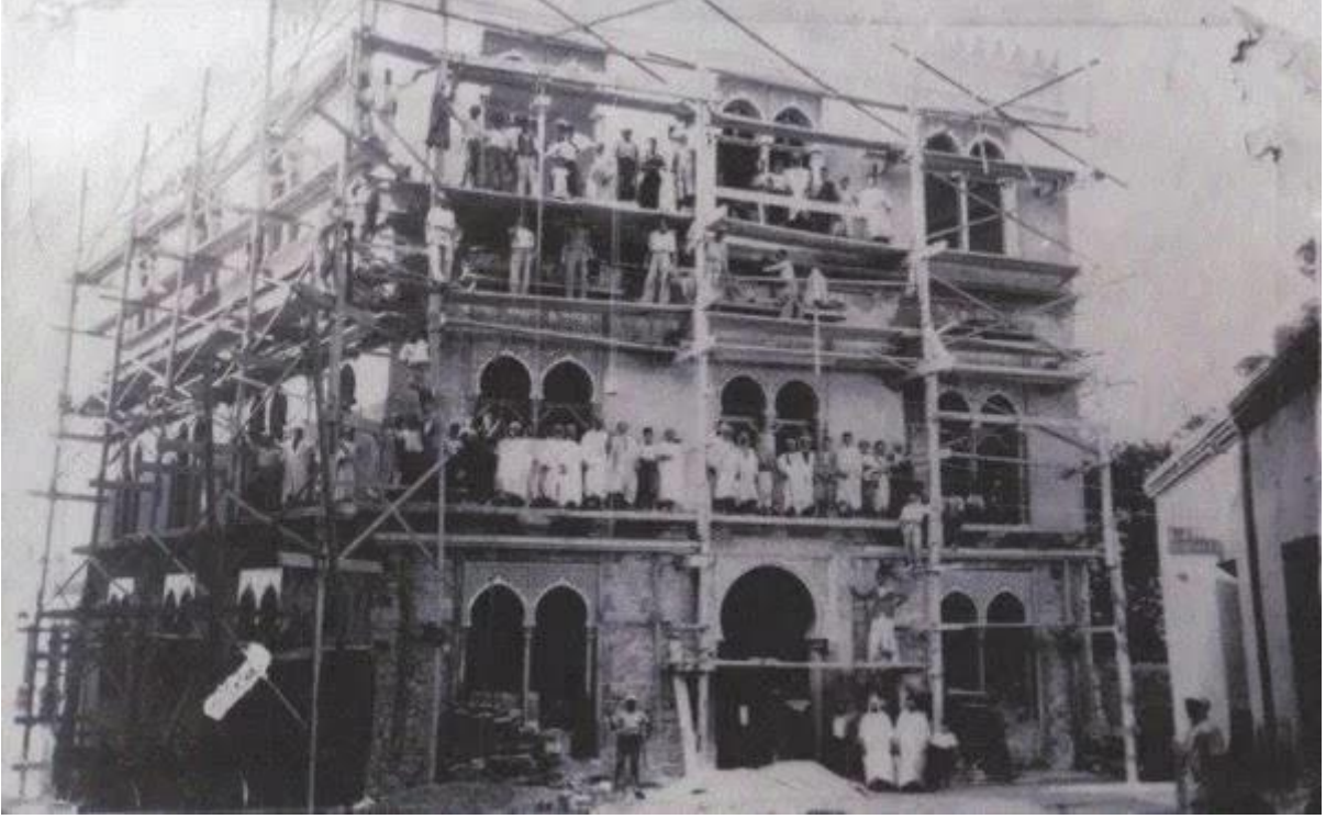
صورة دار الحديث وهي في مرحلة البناء