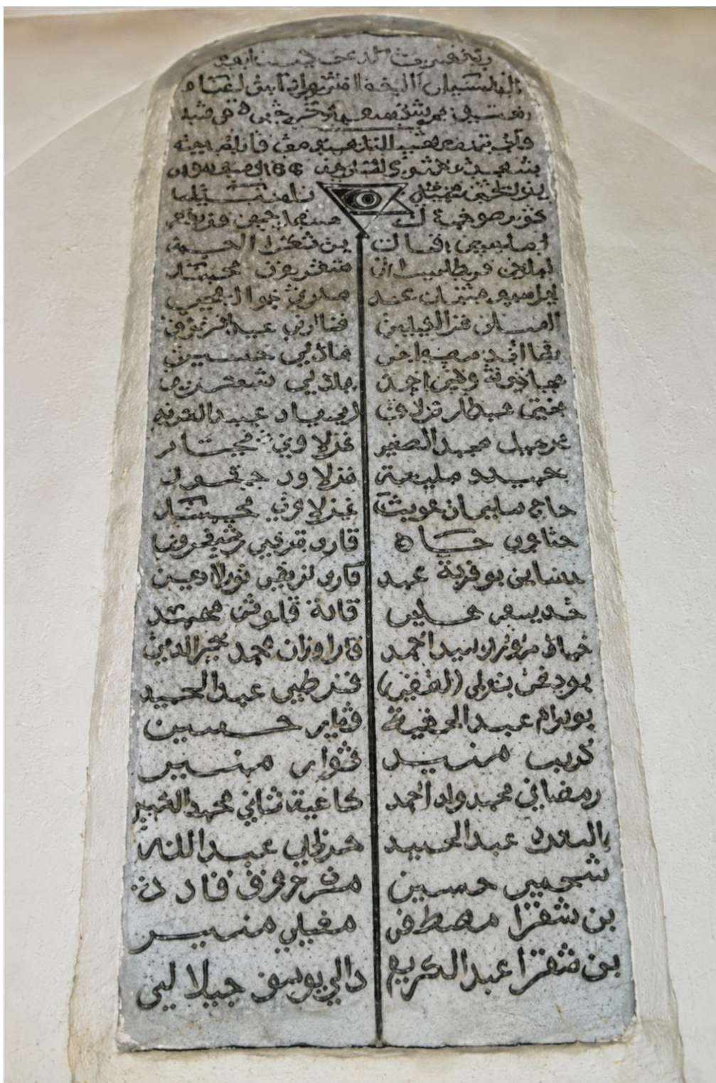
لوحة جدارية معلقة على مدخل دار الحديث فيها أسماء طلاب دار الحديث الذين أستشهدوا