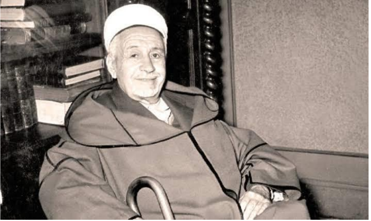
صورة الشيخ البشير الإبراهيمي