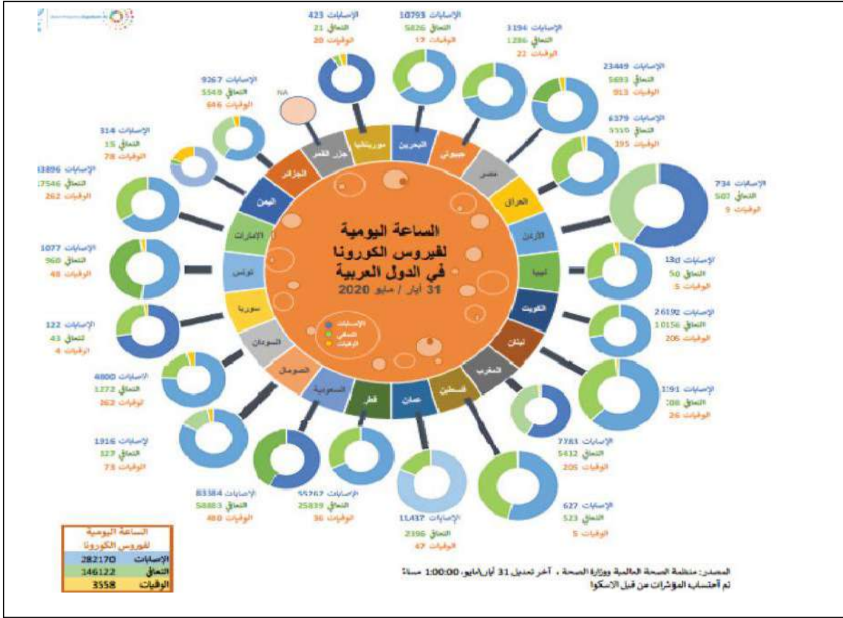
الشكل رقم 02 انتشار فيروس كورونا في المنطقة العربية الى غاية 31 ماي