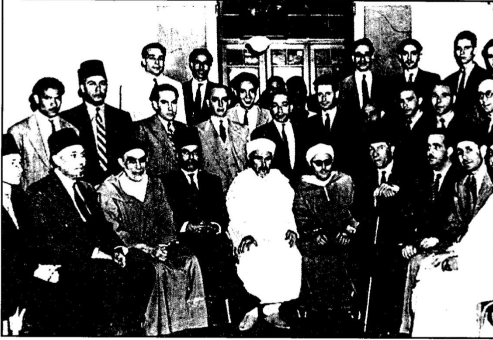
يظهر في الصورة الزعيم الحبيب بورقيبة على يمين بطل الريف الأمير عبد الكريم الخطابي إثر لجوئه إلى القاهرة في ماي 1947 كما يظهر في أقصى يمين الصف الثاني المناضل الدكتور الحبيب ثامر مدير مكتب المغرب العربي بالقاهرة

العنوان : صورة عبد الكريم الخطابي يتوسط الوطنيين المغاربة في المكتب المغرب العربي بالقاهرة ( إثر إنعقاد مؤتمر مع شقيقه ) .